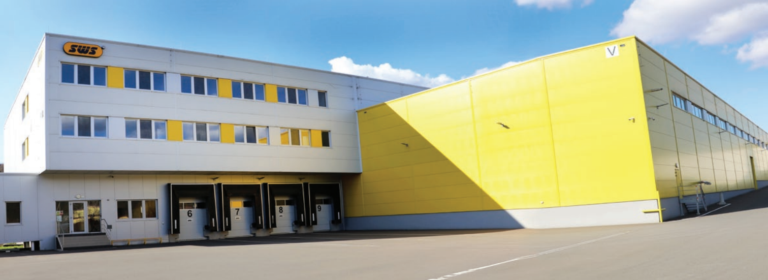
SKLADOVACÍ HALA / STORAGE HALL